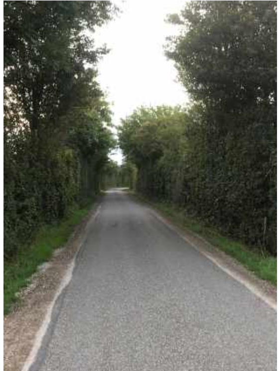
voorbeeld van een weg met dichte begroeiing

De verkeersveiligheid is wel een onderwerp dat verscheidene keren ter sprake is geweest. Hogere begroeiing langs (verharde) wegen kan verkeer het uitzicht ontnemen en derhalve onveilige situaties doen ontstaan. Aan de andere kant is uit voorbeelden elders vernomen dat op een weg waar weinig (voor-) uitzicht is automatisch langzamer gereden wordt.